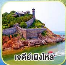
เจดีย์เฝิงไหล