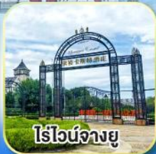
ไร่วุ้นจางยู