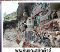
พระหินแกะสลักตำจู้