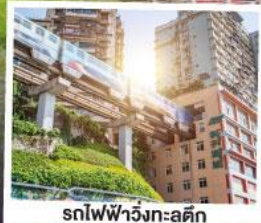
รถไฟฟ้าวิ่งทะลุคิก