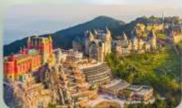
เที่ยวบานาฮิลล์เต็มวัน

TTC HOI AN HOTEL หรือเทียบเท่ามาตรฐานเวียดนาม