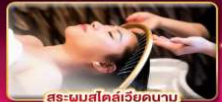
สระผมสไตล์เวียดนาม