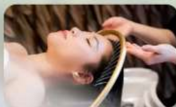
สระผสมสโตร์เวียดนาม