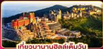
เที่ยวบานาฮิลล์เต็มวัน

ล่องกระทงขามดำคืนที่ฮอยอัน ไฟล์ทสวย บินเช้า-กลับเย็น