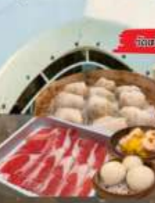
วัดของสามเซียน