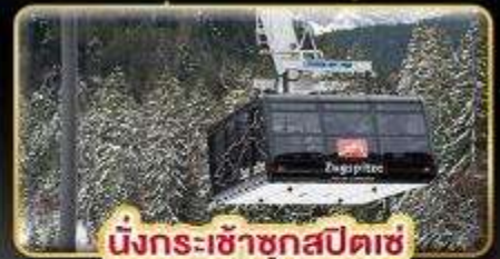
นั่งกระเช้าชุกสปีตซ์