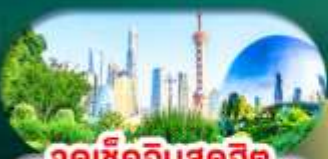
จุดเช็คอินสุดฮิต North Bund Shanghai

เซี่ยงไฮ้ หางโจว ล่องทะเลสาบซีหู ฟรีเดย์