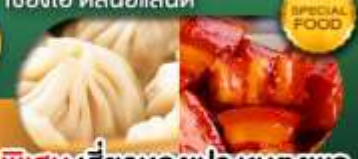
พิเศษ เสี่ยวหลงเป่า หมูแดงพอ เดินทาง ม.ค. - มิ.ย. 69