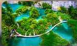
อุทยานแห่งชาติพลีทวิเซ่