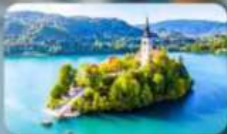
โบสถ์พระแม่มาเรียแห่งบลัด