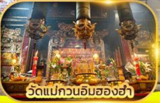
วัดแม่กวนอิมสองข่า