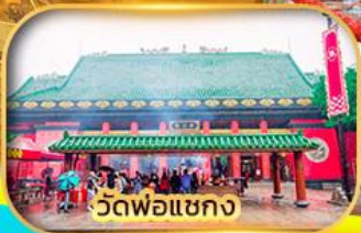
วัดพ่อแชกง