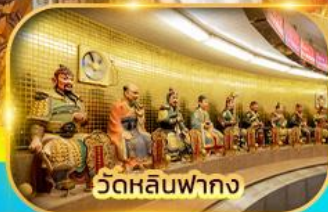
วัดหลินฟาถง