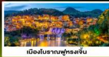
เมืองโบราณฟุทงเจิ้น