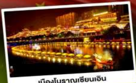
เมืองโบราณเซียนเ็น