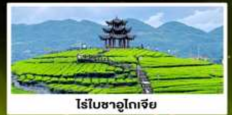
ไร่ชาอูโตเจีย