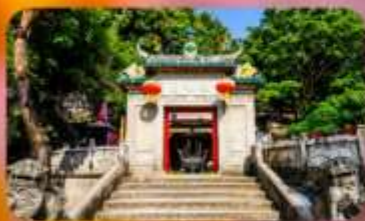
วัดอาเมา