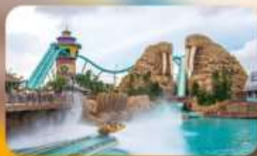
Chimelong Ocean Kingdom