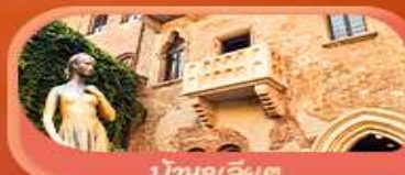
บ้านจูเลียต