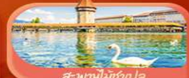
สะพานไมซ์ฮอป

Highlight เยือนหมู่บ้านแสนสวยเซอร์แมท เช็กอินศาลาไทยสุดงามที่โลซาน เที่ยวลูเซิร์น ชมสะพานไม้ชาเปลและอนุสาวรีย์สิงโต ซาสี แอปสลิน ชมประติมากรรม The Fork และปราสาทซิลลองริมทะเลสาบ เยือนมิลาน มหาวิหารดูโอโม เที่ยวเวนิส เมืองลอยน้ำสุดโรแมนติก อินกับรักอมตะที่บ้านจูเลียต และช้อปปิ้งจุใจที่ Serravalle Outlet