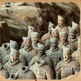
“สุสานจีนซีฮ่องเต้”