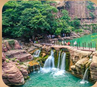
“อุทยานหยุนไท่ซาน”

ชมถ้ำหลงเหมิน มรดกโลกที่เมืองลั่วหยาง • สุสานจีนซีฮ่องเต้ • ศาลเจ้ากวนอู วัดเส้าหลิน + ป่าเจดีย์ + ชมโชว์กังฟู • เมืองโบราณลั่วอี้ • อุทยานหยุนไท่ซาน เจดีย์ห่านป่าใหญ่ • ถนนวัฒนธรรมต้ากิง • ถนนคนเดินอิสลาม • จัตุรัสหอระฆัง