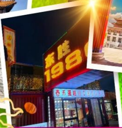
ถนนคนเดินคังบาร์ซี