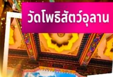
วัดโพธิ์สัตว์อุลัน