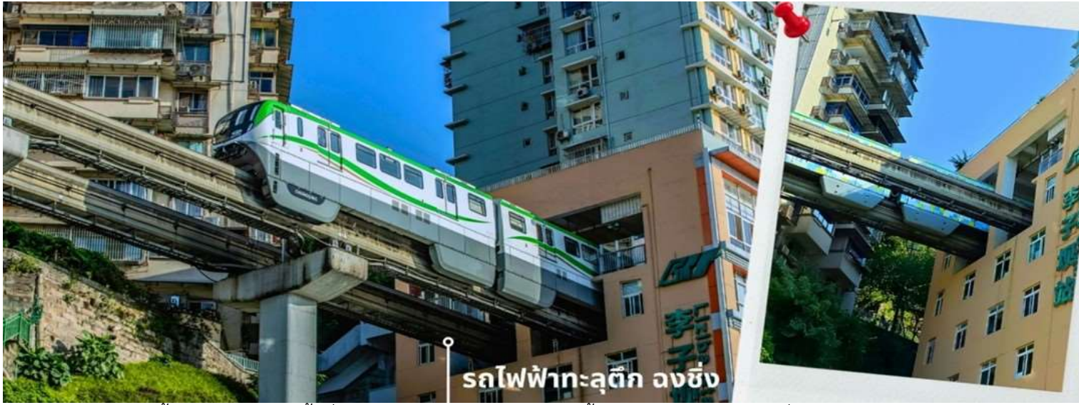
รถไฟฟ้าทะลุตึก ลงชิง

ผู้โดยสารบนขบวนรถไฟและผู้เข้าชมจากจุดชมวิวที่ต่างตื่นตันทันไปตามๆกันกับการที่ได้เห็นรถไฟวิ่งทะลุตึกนี้ สถานี Liziba ได้รับการยกย่องให้เป็น 1 ในสถานที่สำคัญที่สะท้อนความเติบโตของจีนตลอด 70 ปี ซึ่งไม่ได้เกิดขึ้นโดยบังเอิญ รถไฟฟ้าทะลุตึกนี้คือตัวอย่างของความอัจฉริยะในการออกแบบการคมนาคมในเมืองภูเขาแห่งนี้ให้ท่านได้สัมผัสประสบการณ์กับการขึ้นนั่งบนรถไฟเพื่อผ่านทะลุตึกและเก็บภาพบรรยากาศ