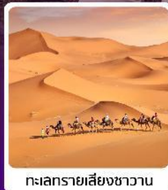
ทะเลทรายเสี่ยชวาน