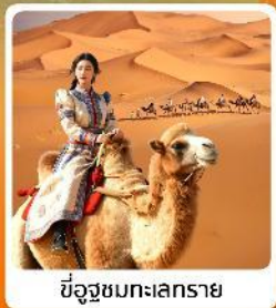
ขี่อูฐชมทะเลทราย