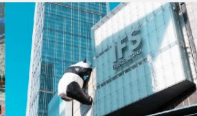
แพนด้ายักษ์ปิ่นตึก IFS

*ทางบริษัทฯ ขอสงวนสิทธิ์ในการสลับโปรแกรมทัวร์ตามความเหมาะสมขึ้นอยู่กับสถานการณ์หน้างาน โดยคำนึงถึงผลประโยชน์ของลูกค้าเป็นสำคัญ