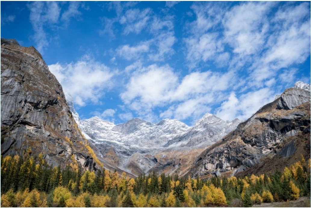
ฤดูใบไม้ร่วง (AUTUMN)