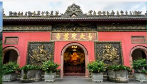
วัดต้าจื่อ