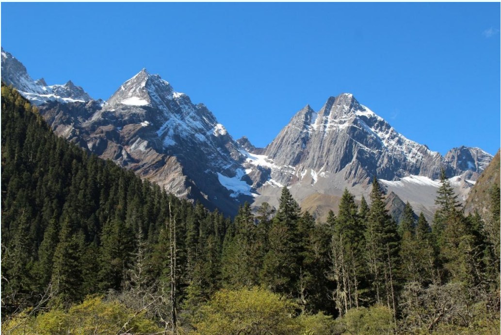
ฤดูใบไม้ผลิ (SPRING)