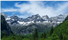
ภูเขาสีดรุณี (หุบเขาชวงเจียวโกว)