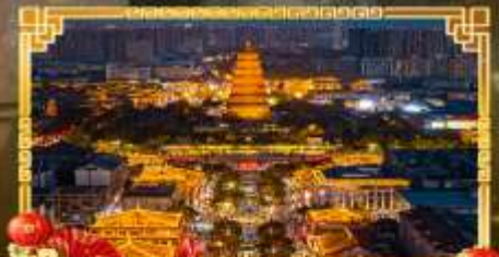
ถนนคนเดินราชวงศ์ถัง