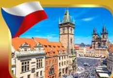
ชมวิวยุโรปจากเมืองปราก