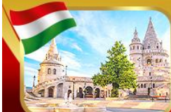
ป้อมชาวประมงเมืองบูดาเปสต์