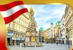
ช้อปปิ้งย่านคาร์ทเนอร์สตรีก