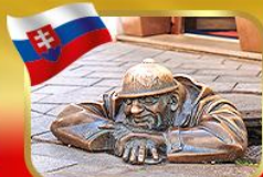
เศ็คอินคูลึ่มเมืองบาติสลาวา