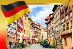
เที่ยวย่านเมืองเก่าบูมเบอริก