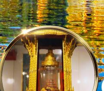
พิพิธภัณฑ์ กรุงนิวเดลี กราบมัสการพระบรมสารีริกธาตุ