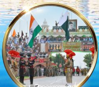
พิธีลดธงชัยแดน อินเดีย-ปากีสถาน ผ่านวาทะ