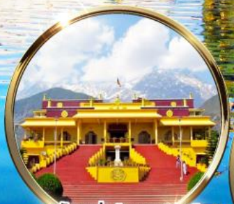
ดาริมซาล่า "ธรรมศาลา" ตำหนักองค์ดาโลลามะ