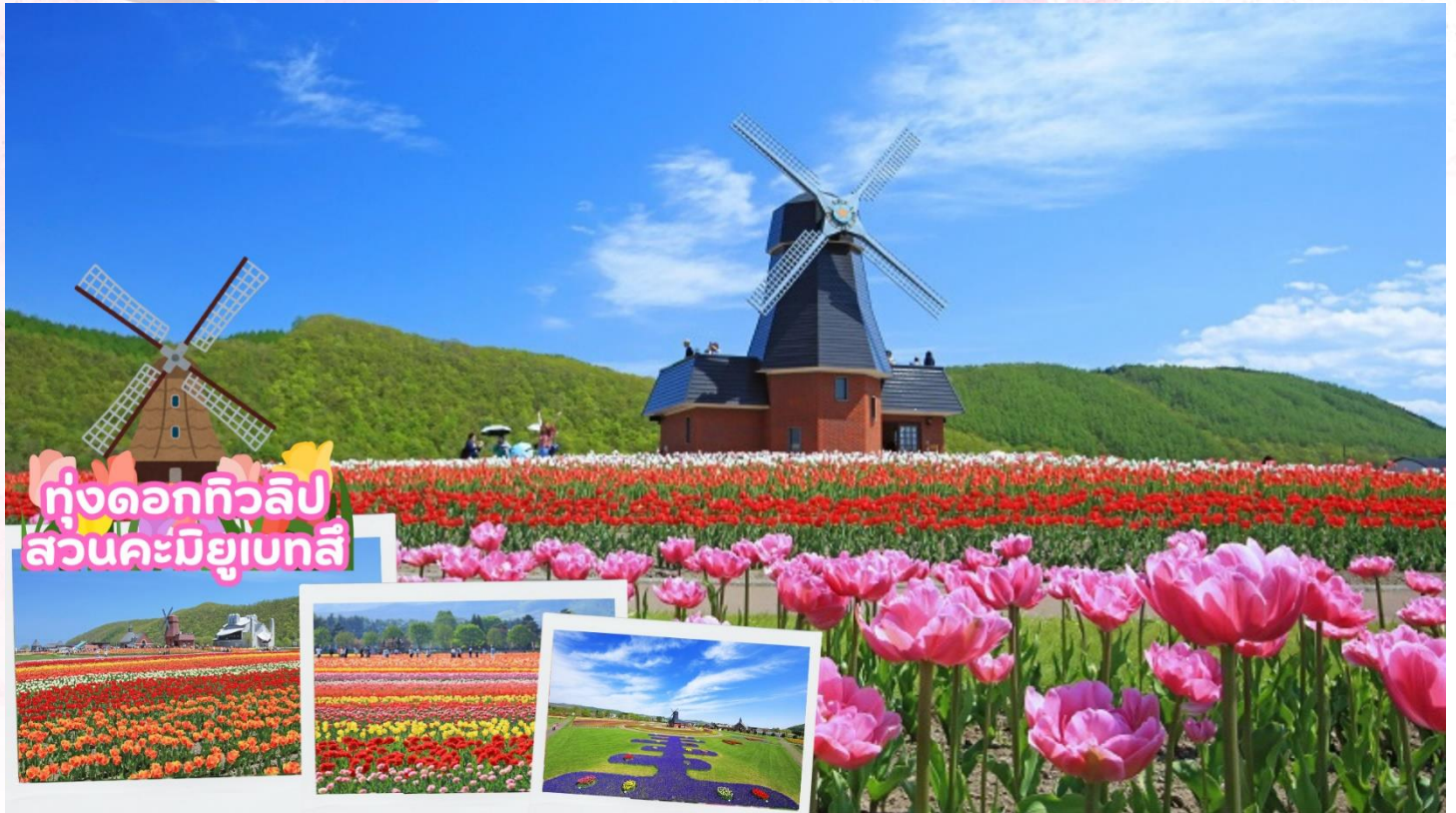
ทุ่งดอกทิวลิป สวนคะมิยูเบทสึ

จากนั้นนำท่านชมทุ่งดอกทิวลิป ณ สวนคะมิยูเบทสึ (Kamiyubetsu Tulip Park) จากสวนดอกไม้เล็ก ๆ ที่ถูกสร้างขึ้นโดยคนท้องถิ่นเพื่อสืบทอดดอกทิวลิป [ดอกไม้ประจำเมือง] ไปสู่รุ่นต่อไป และได้พัฒนา มาเป็นอุทยานทิวลิปคะมิยูเบทสึ ปัจจุบันอุทยานแห่งนี้มีดอกทิวลิปสีแสนสดใส กว่า 1,200,000 ดอก จาก กว่า 120 สายพันธุ์ ที่จะบานทั่วทั้งสวนในฤดูใบไม้ผลิ [ขึ้นอยู่กับสภาพอากาศ]