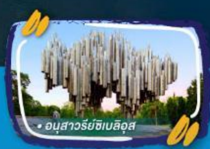
• อุนสาวรีย์ซิมลิส