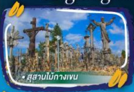
• สวนไม้กางเขน