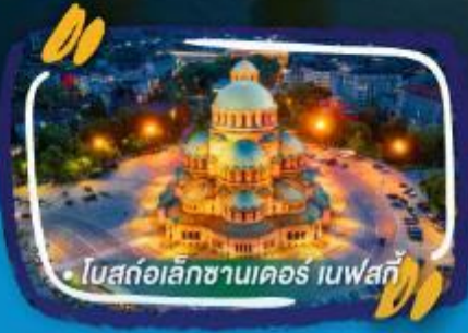
• โบสถ์อเล็กซานเดอร์ เนฟสกี