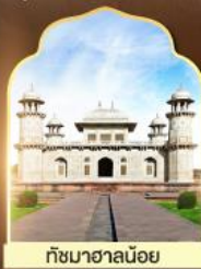
กษมาชอลน้อย