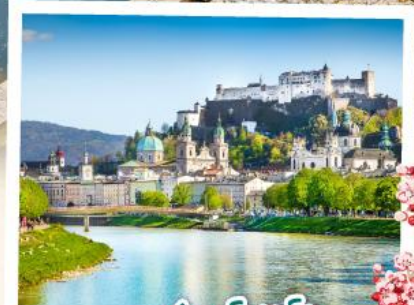
ซาลซ์บวร์ก