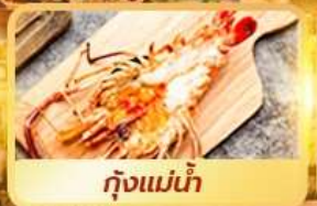
กุ้งแม่น้ำ