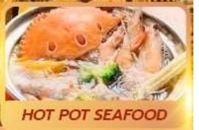
HOT POT SEAFOOD