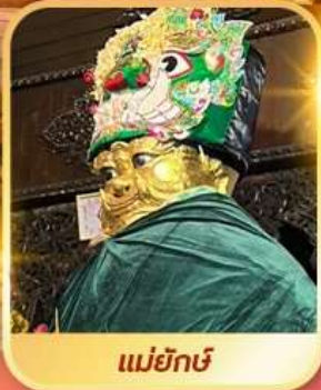
แม่ยักษ์