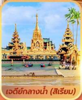
เจดีย์กลางน้ำ (สิริเยม)