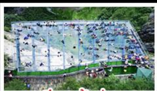
ระเบียงแก้วอยู่หลง