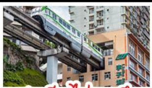
สถานีรถไฟ-ลู่ตีก

ชิง - อุโมงค์ - หงหยาดัง อุทยานเทานางฟ้าชิง สถานีรถไฟ-ลู่ตีก หมู่บ้านสามสะพานสวรรค์