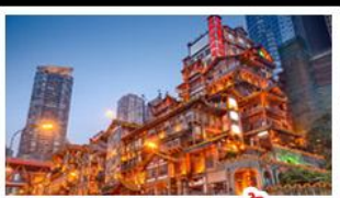
ตลาดแดงเซาตัง