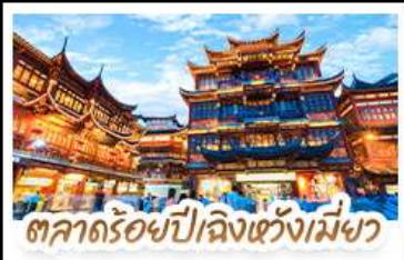
ตลาดร้อยปีลิ่งเซวี่งเม่ิงว