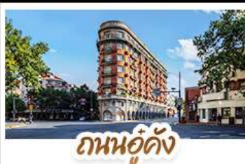
ถนนอู๋ดิง