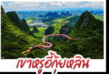
เขาเขรู้อี้กุ้ยหลิน