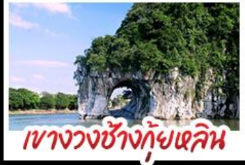
เขาวงกตช้างกุ้ยหลิน

ห้องเรือแม่น้ำที่เจียง สวนสตรอว์เบอร์รี่ ทัศนียภาพที่สวยงาม นั่งบอลูนชมวิว 360 องศา ทางวงช้างกุ้ยหลิน ทำฝู้อ้อ พาหุรู้อี้ เมืองกุ้ยหลิน รถไฟความเร็วสูง พักโรงแรมระดับ 5 ดาว เมบูอาหารพิศข POP MART