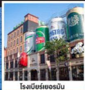
โรงเบียร์เยอรมัน