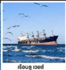
เรือลู เวย์ส