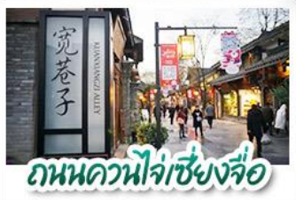
ถนนควนไท่จี่เซียงจื่อ