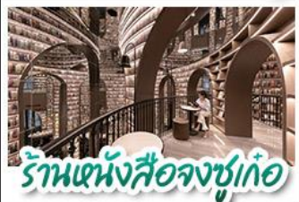
ร้านหนังสือจงซูเก๋

อุทยานสี่ครุณี - อุทยานปืฝิ่งโกว - วัดต้าฉือ หมีแพนด้าบนเฉลยฟี - ร้านหนังสือจงซูเก๋ ถนนโบราณชองกวางฮวยแคบ ช้อปปิ้งถนนไท่กู่หลี่ + ถนนชุนซีลู่ CHENGDU TIMES OUTLETS