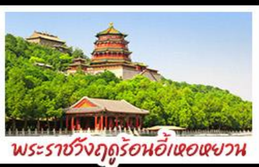
พระราชวังฤดูร้อนอี้ทงหยวน

ท่าอากาศยานจีนด่านจวิ๊ยงกวน - พระราชวังฤดูร้อนอี้ทงหยวน สวนจิ้งอัน - วัดลามะ - ไม่ลงร้านช้อปปิ้ง - โรงแรม 4 ดาว มือพิเศษ เปิดปีกถึง สุกี้มองโก MICHELIN GUIDE ร้าน TAO TAO JU