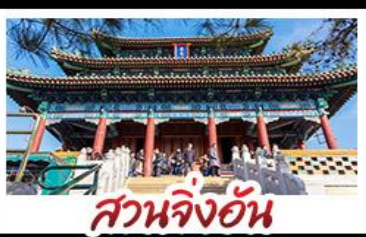
สวนจิ้งอัน