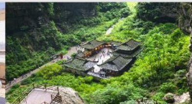
อุทยานแห่งชาติบ่อหลุมฟ้า

*ทางบริษัทฯ ขอสงวนสิทธิ์ในการสลับโปรแกรมทัวร์ตามความเหมาะสมขึ้นอยู่กับสถานการณ์หน้างาน โดยคำนึงถึงผลประโยชน์ของลูกค้าเป็นสำคัญ