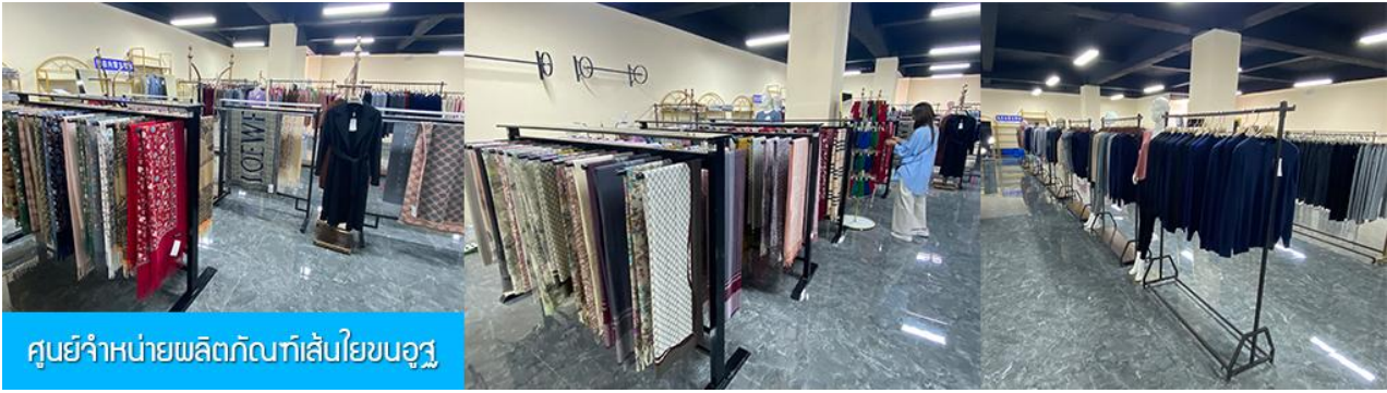
ศูนย์จำหน่ายผลิตภัณฑ์เส้นใยขนอูฐ