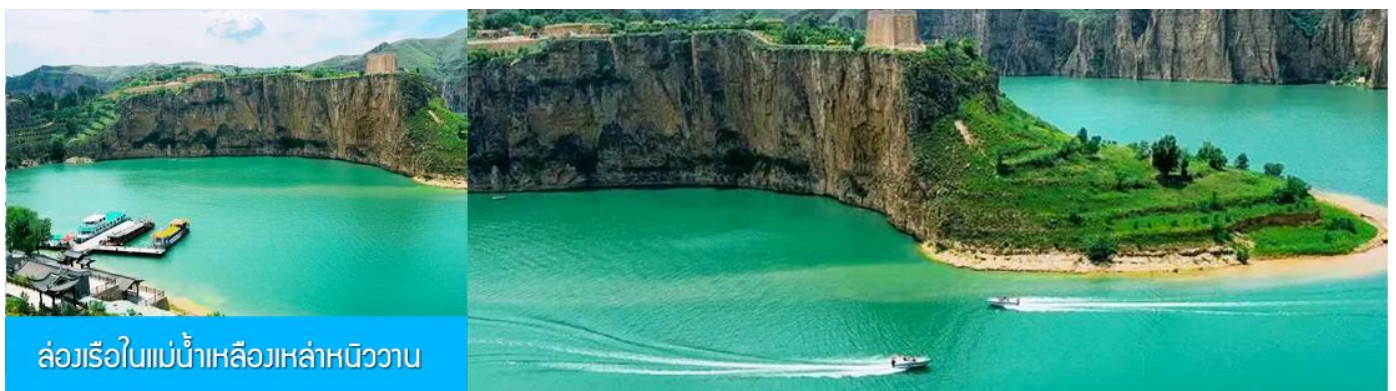
ล่องเรือในแม่น้ำเหลืองเหล่าหนิววาน

เที่ยง รับประทานอาหารกลางวัน ณ ร้านอาหารระหว่างทาง (8)