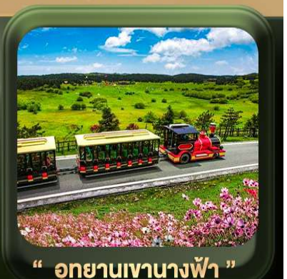
“ อุทยานเขานางฟ้า ”

T2G-CKG26CZ Special of Chongqing... วงซิ่ง ต้าจู้ อุ้หลง อุทยานหลุมฟ้า เขานางฟ้า 5D 3N (CZ)