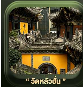
“ วัดหลิวอัน ”