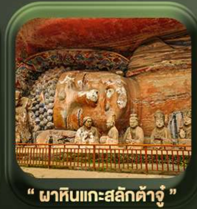
“ พาทินแคะสลักต้าจู้ ”