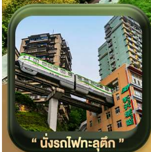
“ นิ่งรถไฟคะลุค ”

บินตรงลงวงซิ่ง • อุ้หลง หลุมฟ้าสะพานสวรรค์ • ระเบียบแกว • อุทยานเขานางฟ้า หงหยาดัง • นิ่งรถไฟคะลุค • ศาลาประชาคม (ด้านนอก) • หลงหมินฮ่าว มรดกโลกพาทินแคะสลักต้าจู้ • วัดหลิวอัน • ตึกตะเกียบ • ถนนคนเดินเจียฟ้างเป่ย์