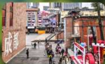
ตงเจียวจื่ออี