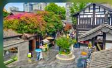
ถนนชอยกวางชอยแคบ