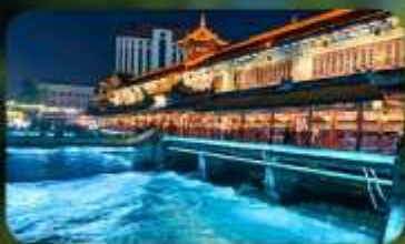
สะพานหนานเฉียว