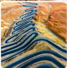
ถนนผานหลงกู่ต้าว