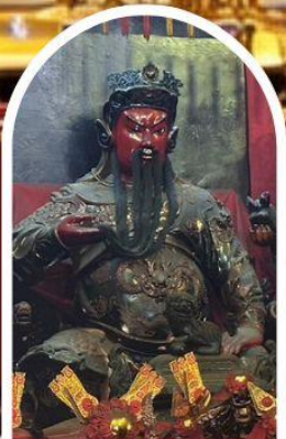
วัดกวนไท่ ขอเทพเจ้ากวนอู ความซื่อสัตย์ เงินทอง ธุรกิจมั่นคง