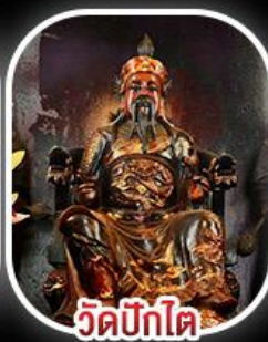
วัดบิกิต