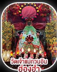
วัดเจ้าแม่กวนอิม สองฮ่า