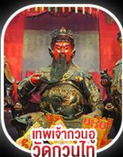
เทพเจ้ากวนอู วัดกวนไท