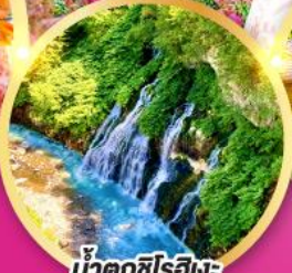
น้ำตกชิโรอิเงะ