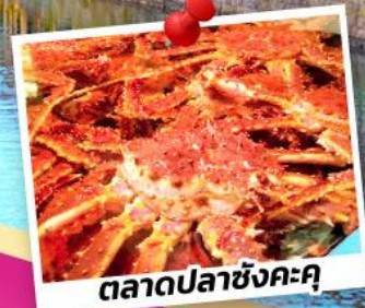
ตลาดปลาซังคะคุ