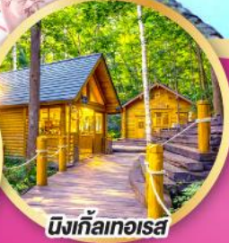
มิงกัลเกอเรส