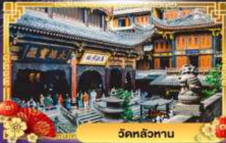
วัดหลัวหนาน