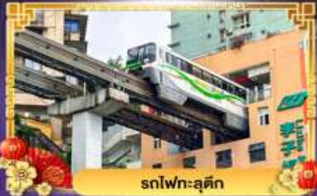
รถไฟฟ้า-ลู่ตัก