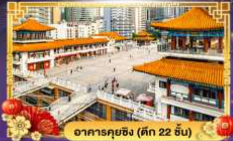
อาคารคุยซิง (ตึก 22 ชั้น)