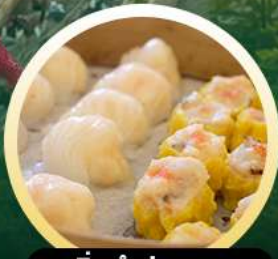
ติ่มซ่าฮ่องกง