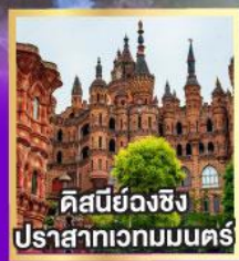
คิสนียงฉิ่ง ปราสาทเวทมนตร์