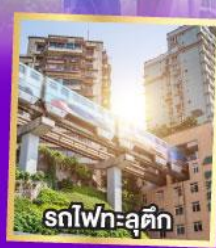
รถไฟฟ้า-สุตัก

เที่ยวเต็มอิ่ม..ไม่ลงร้านช้อปปิ้ง นั่งรถไฟความเร็วสูง 2 เที่ยว ไม่มีออฟชั่นเพิ่ม