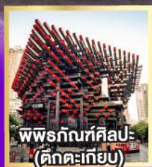
พิพิธภัณฑ์ศิลปะ (ตึกคะเกียบ)