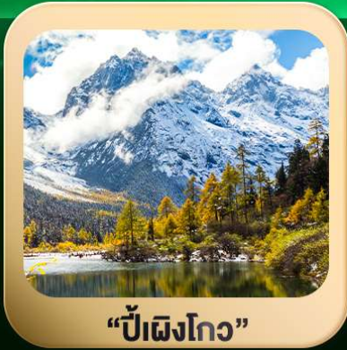
“ปี่ผิงโกว”

ชมธรรมชาติ 2 อุทยานขึ้นชื่อ อุทยานภูเขาสีดรุณี + อุทยานปี่ผิงโกว สะพานหนานเฉียว • ถนนคนเดินไท่กุ่หลี่ + ซุนซีลู่ + Pop Mart • ดงเจียวจื่อ