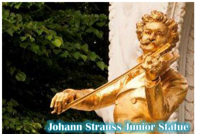
Johann Strauss Junior Statue

เช้า บริการอาหารเช้า ณ ห้องอาหารของโรงแรม นำท่านออกเดินทางเข้าสู่ใจกลาง “กรุง เวียนนา” (Vienna) ผ่าน “ถนนวงแหวน” Ring Strasse ซึ่งเป็นที่ตั้งของ โรง อوبرาการ์ (โอเปร่าเฮาส์), พระราชวังฮอฟบวร์ก, อาคาร รัฐสภา, ศาลาว่าการ, มหาวิทยาลัยเวียนนา, โบสถ์ประจำเมือง, ศาลสูง ฯลฯ เดินทางสู่ “สวนสาธารณะสตัดท์ปาร์ค” สวนสาธารณะอัน ร่มรื่นใจกลางเมือง ชม “ อนุสาวรีย์ โยฮัน สเต ร้าวส์ จูเนียร์ ” Johann Strauss ศิลปินที่มี ชื่อเสียงก้องโลก