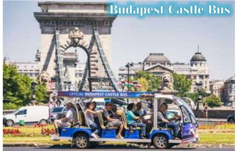
Budapest Castle Bus

บูดา Castle Hill *เนื่องจากตัวปราสาทตั้งอยู่บนเนินเขา การเดินทางโดยรถไฟไฟฟ้า จะเพิ่มความสะดวกสบายให้กับท่าน โดยรถไฟไฟฟ้าจะจอดรับและส่งตามจุดต่างๆ ในย่านเมืองเก่า ไม่ต้องเดินเท้าเป็นระยะทางไกล* จากนั้นนำท่านเดินชมความงดงามของเมืองเก่ารอบๆปราสาทบูดา ที่เริ่มมีการก่อสร้างมาตั้งแต่ปี ค.ศ.1265 และต่อเติมปรับปรุงมาโดยตลอด จนกระทั่งปัจจุบัน โดยตัวอาคารในปัจจุบันเราจะเห็นเป็นสไตล์บาโรก ที่ดู