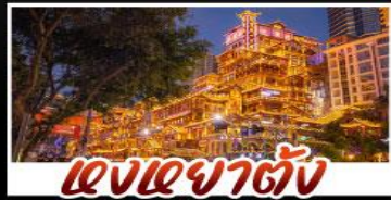
แสงอาคารต่าง

สัมผัสประสบการณ์เที่ยวจีนแบบเต็มอิ่ม ทั้งความล้ำสมัยของมหานครฉงชิ่ง และความงดงามตระการตาของธรรมชาติที่จุ่หลง ทุกการเดินทางเต็มไปด้วยความสะดวกสบายและคุ้มค่าที่สุด! ราคาพิเศษ