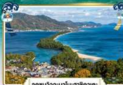
จุดชมวิวอะมาโนฮาซิดาเตะ