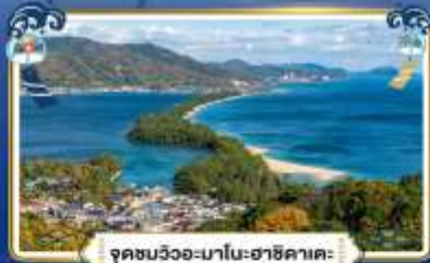
จุดชมวิวงะมาโนะฮาชิคาตะ