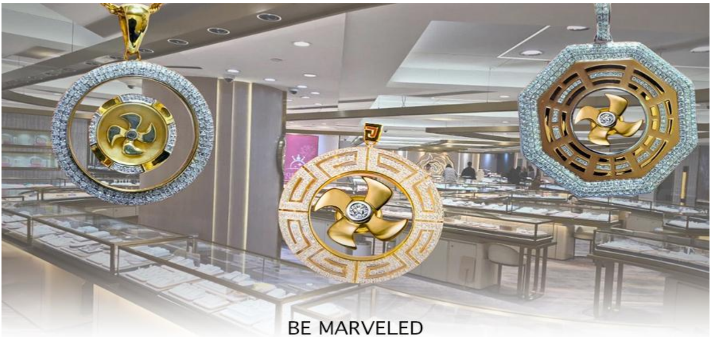
BE MARVELED ศูนย์ฮวงจุ้ย กังหันเศรษฐี

นำท่านชม ศูนย์ฮวงจุ้ย กังหันเศรษฐี ที่ขึ้นชื่อของฮ่องกง ท่านจะได้พบกับงานดีไซน์ที่ได้รับรางวัลยอดเยี่ยม และใช้ในการเสริมดวงเรื่องฮวงจุ้ย โดยการย่อใบพัดของกังหันที่เป็นสัญลักษณ์ของวัดวัดเซ่งจี้มาทำเป็นเครื่องประดับ ไม่ว่าจะเป็นจี้, แหวน, กำไล หรือต่างหูเพื่อเป็นเครื่องประดับติดตัว และเสริมดวงชะตา ซึ่งสินค้าทุกชิ้น มีเอกสาร รับประกันคุณภาพเปลี่ยนหรือซ่อม ได้ตลอดอายุการใช้งาน หากเกิดการชำรุดจากสินค้าไม่ใช่อุบัติเหตุ