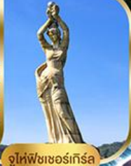
จูไห่ฟิชเชอร์เก็ส