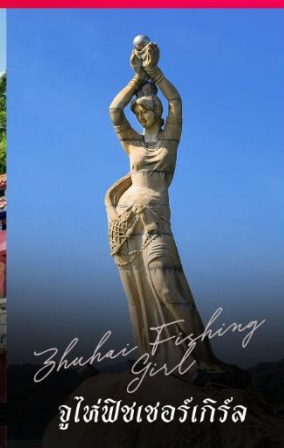
Zhuhai Fishing Girl จูไห่ฟิชเชอร์เก็ท