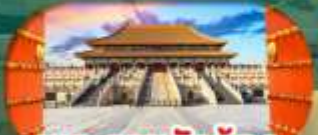
พระราชวังต้องห้าม Forbidden City Beijing