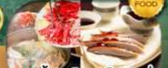
เมนู สุกี้ม้งโก + เปิดปักกิ่ง เดินทาง เม.ษ. - ต.ค. 69