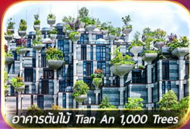
อาคารต้นไม้ Tian An 1,000 Trees