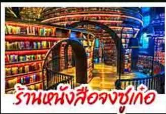
ร้านหนังสือจุงชู่เก้อ