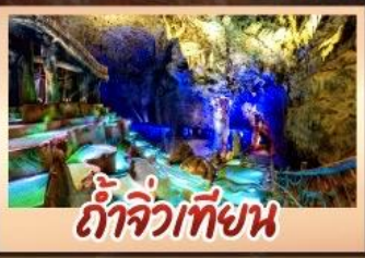
ถ้ำจิวเทียน